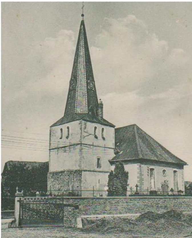
Kirche zum Heiligen Kreuz, Sehnde um 1930