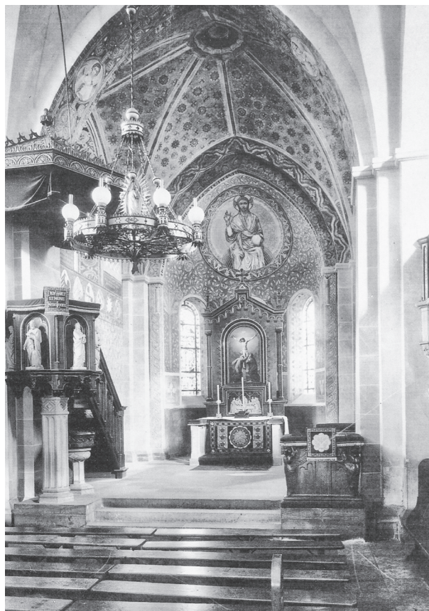
Der Chorraum in der 2. Hälfte des 19. Jahrhunderts

Das Bild des Chorraums vermittelt mit Kanzel, Schalldeckel, Kronleuchter, Lesepult und Ausmalung des Chores einen fast barocken Eindruck.