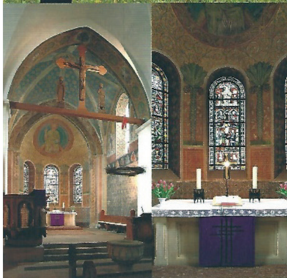
Klosterkirche mit Friedhof sowie Chor und Altarraum heute