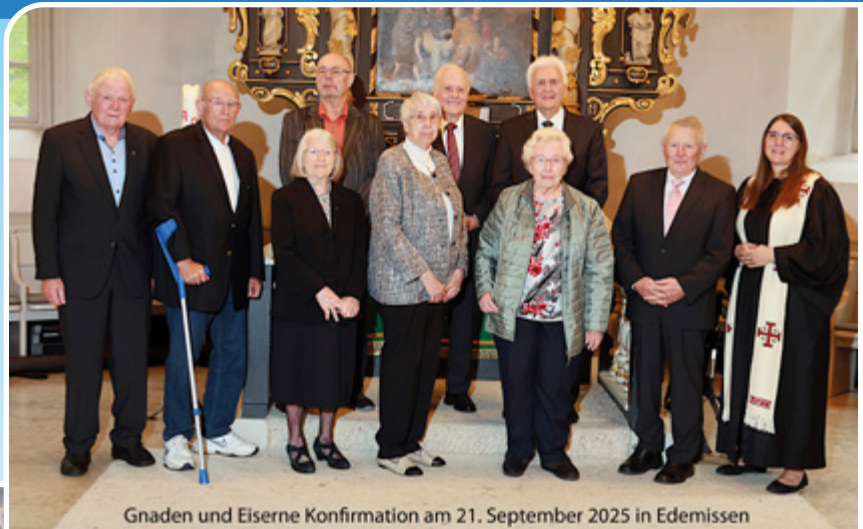
Gnaden und Eiserne Konfirmation am 21. September 2025 in Edemissen