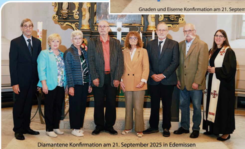
Diamantene Konfirmation am 21. September 2025 in Edemissen