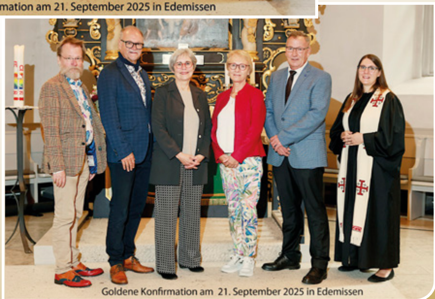
Goldene Konfirmation am 21. September 2025 in Edemissen