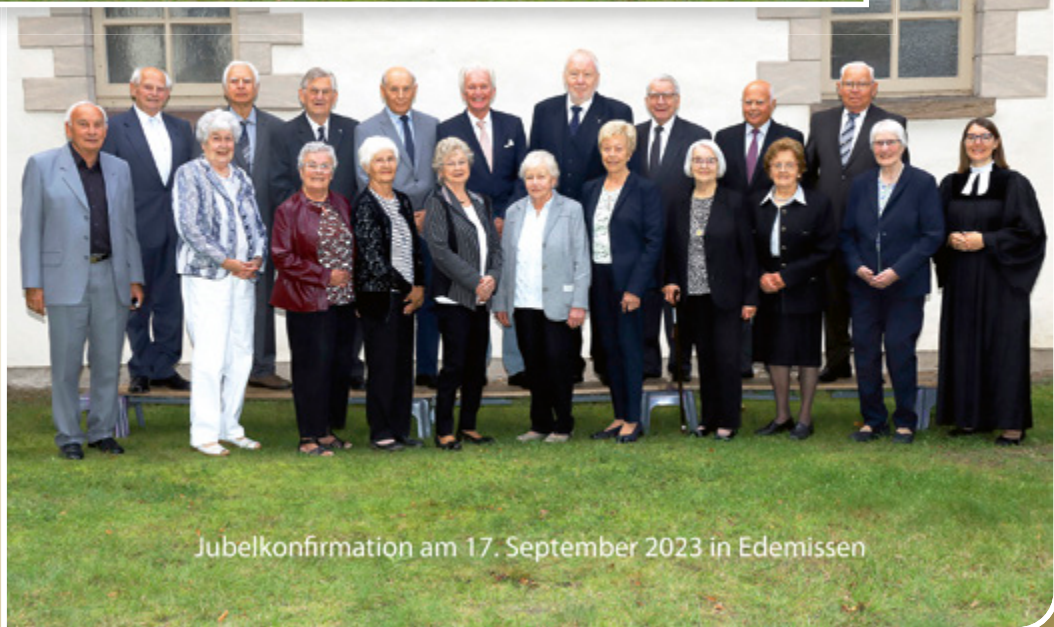
Jubelkonfirmation am 17. September 2023 in Edemissen