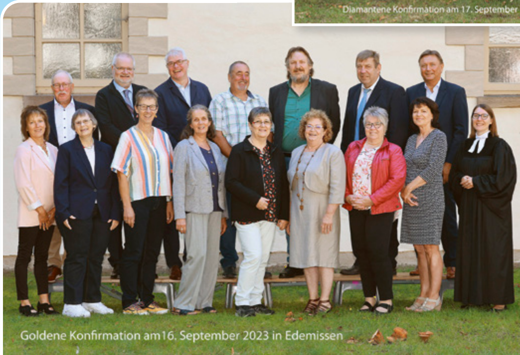
Goldene Konfirmation am 16. September 2023 in Edemissen