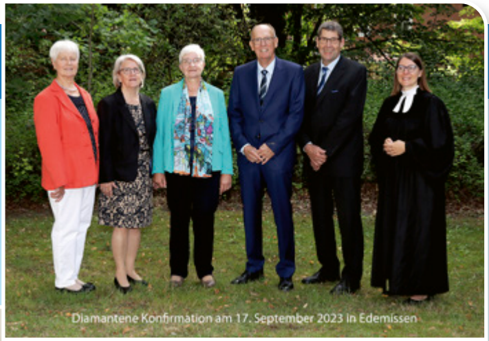
Diamantene Konfirmation am 17. September 2023 in Edemissen