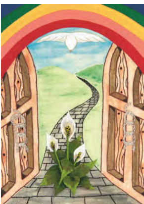
© 2020 World Day of Prayer International Committee, Inc.

Der diesjährige Weltgebetstag wurde von Frauen aus England, Wales und Nordirland thematisch vorbereitet. Ein ökumenisches Frauenteam der katholischen Corpus-Christi-Gemeinde und der Martin-Luther-Kirchengemeinde Edemissen gestaltete daraus einen lebendigen Gottesdienst, den wir am 5. März in unserer Martin-Luther-Kirche feiern durften. Dabei ging es um die Verheißung Gottes aus dem Buch Jeremia – einem Zukunftsplan Hoffnung – und die