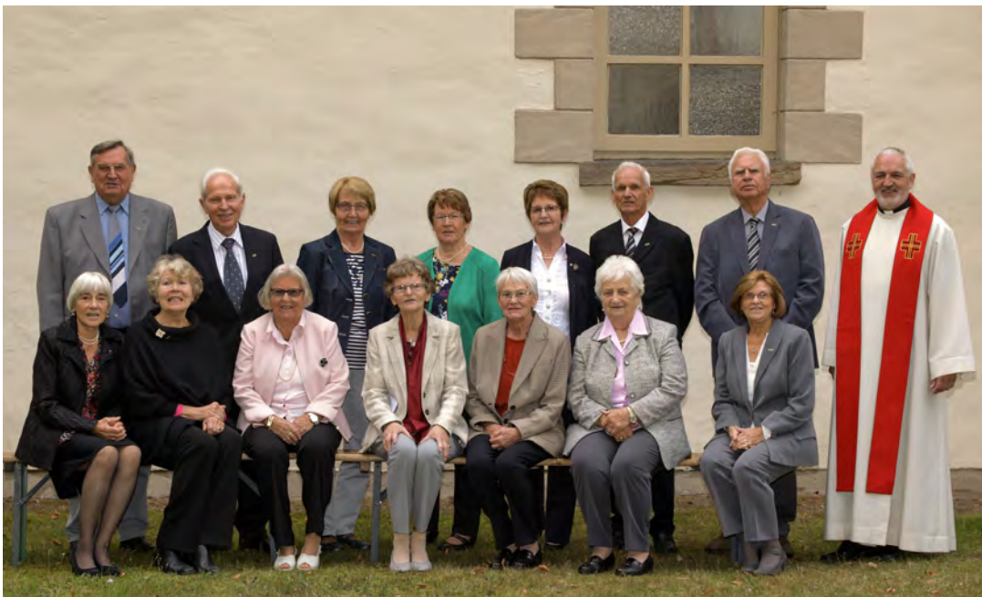
Eiserne und Gnadene Konfirmation