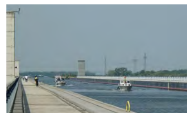
Trogbrücke über die Elbe