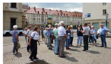
Vor dem Rathauskeller