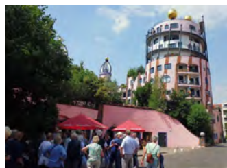
Grüne Zitadelle - Hundertwasserhaus -