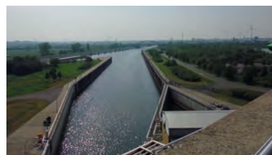
Blick von der Aussichtsplattform