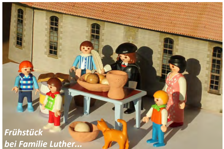
Frühstück bei Familie Luther...

Bitte selber mitbringen: Geschirr; weitere persönliche Frühstückszutaten.