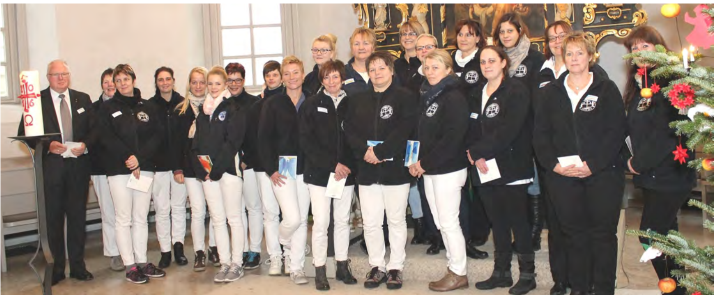
Das Team der Diakoniestation Edemissen gGmbH beim Diakoniegottesdienst am 22.01.2017