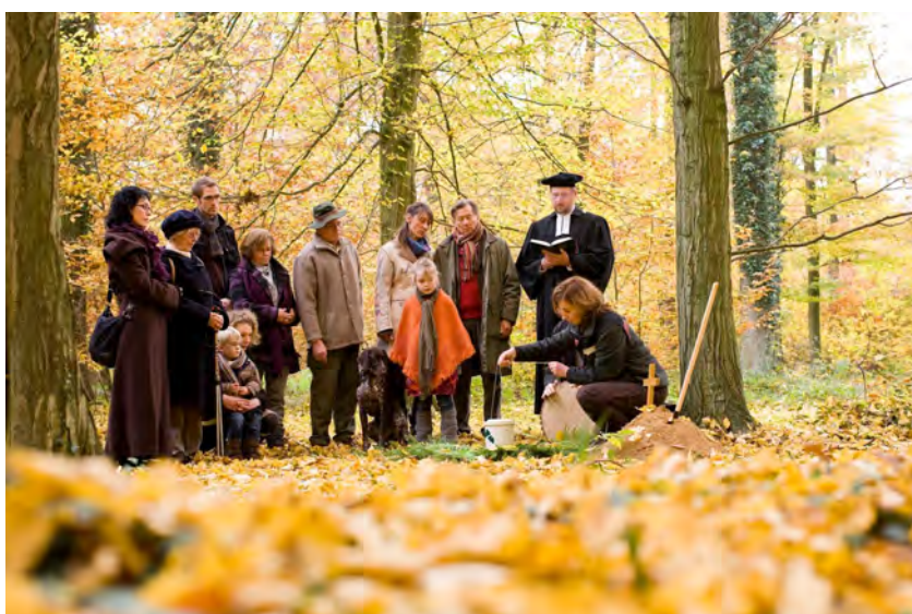
Urnenbeisetzung im Friedwald mit Pastor und Friedwaldförsterin Niklas.

Des Rätsels Lösung: Je nach Farbe des Bandes handelt es sich um unterschiedliche Bestattungsstätten, welche zur Auswahl stehen. Es gibt sogenannte Familienbäume, Partnerbäume, Gemeinschaftsbäume, Basisbäume und als Besonderheit die Sternschnuppenbäume (für verstorbene Kinder). Die kleinen runden Schilder sind ein Hinweis auf die Kosten, die für den jeweiligen Baum veranschlagt werden – diese richten sich nach der Stärke des Stammes. Bei bereits belegten Bäumen sind kleine Namensschilder der dort bestatteten Personen angebracht.