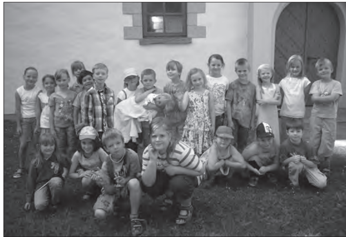
Die Klasse 1b der Grundschule Edemissen vor der Martin-Luther-Kirche.

Die Unterrichtssequenz war für alle Schülerinnen und Schüler ein besonderes Erlebnis, da sie am Originalort und in Originalzusammenhängen Taufe handelnd erlebten. Zum Abschluss wurde ein „Familienfoto“ vor der Kirche gemacht.