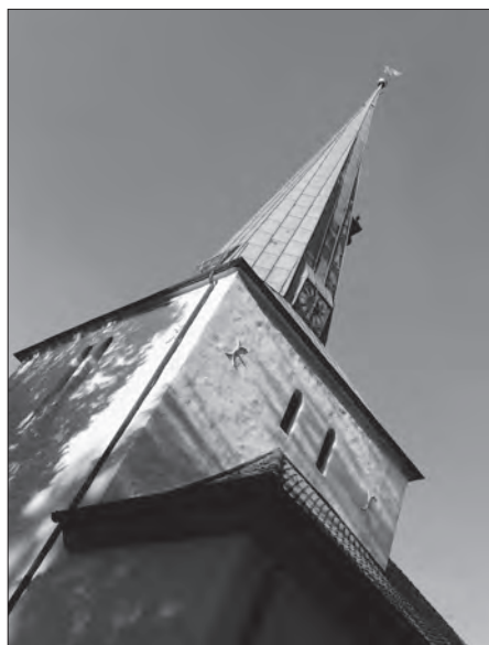
Der Kirchturm unserer Martin-Luther-Kirchengemeinde Edemissen