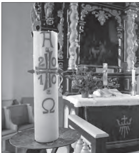
Die Edemisser Osterkerze 2010. Die neue Osterkerze wird in der Osternacht in die Kirche getragen.

„Das Osterlicht ist der Morgenglanz nicht dieser, sondern einer neuen Erde.“