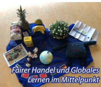
Fairer Handel und Globales Lernen im Mittelpunkt