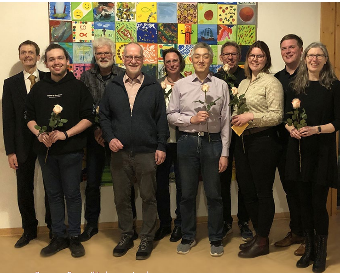
Der neue Gesamtkirchenvorstand

Gemeindebrief der evangelisch-lutherischen Gesamtkirchengemeinde An der Netze