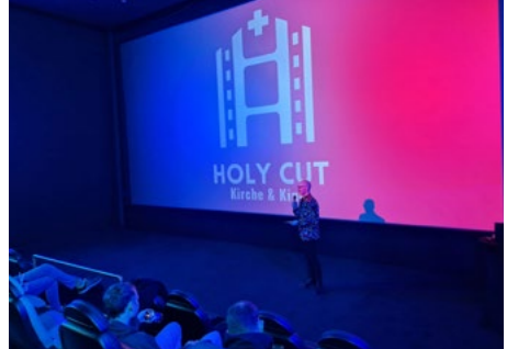
Im März startete die Filmreihe „Holy Cut“.

Mit dem Abenteuerfilm „Life of Pi – Schiffbruch mit Tiger“ machten wir im März den Anfang. Sowohl ins Kino als auch zur Andacht kamen Interessierte aus unserer und anderen Gemeinden sowie einige Menschen, die sonst nichts mit der Kirche zu tun haben. Das Altersspektrum reichte von 13 bis 80. Wir hoffen, dass dieses Interesse anhält.