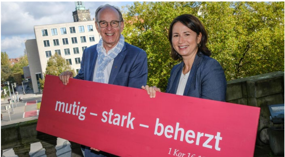
Landesbischof Ralf Meister und Präsidentin Anja Siegesmund mit Losung

>> Der Vorverkauf für Fünf-Tage-Tickets und Tagestickets startet im September 2024. Der Kirchentag informiert online auf kirchentag.de und auf seinen Social-Media-Kanälen über alle wichtigen Neuigkeiten.